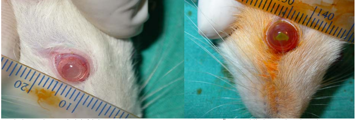
Yeni oluşturulmuş epitel defekti.

Her iki gruptaki epitel defektlerinin kapanan alanların \text{mm}^2 olarak grafiksel gösterimi şekildeki gibi olmaktadır.